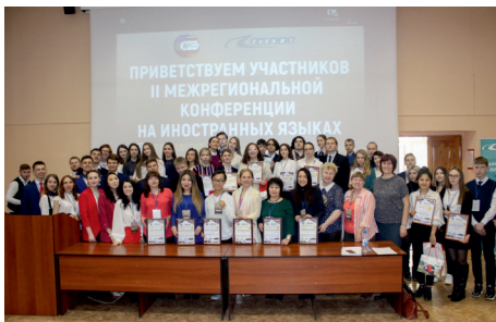
КОНФЕРЕНЦИЯ НА УРА!