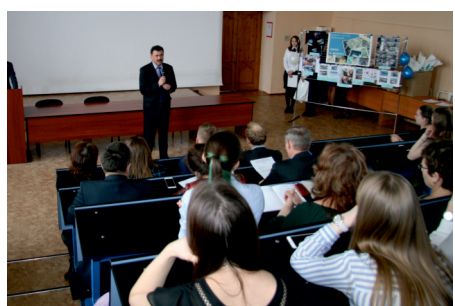
ПРОФСОЮЗ ЗАБИЖТ - В ДЕЙСТВИИ!